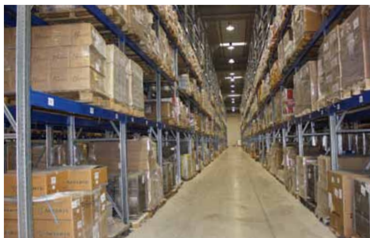
Dal magazzino partono i rifornimenti di materiale, con cadenza quindicinale, a circa 660 destinatari, fra nuclei Enel e imprese appaltatrici

un totale di 30.000 posti pallet su scaffalature al centro (fornite dalla Sacma di Sandigliano) con i muri liberi per garantire ampi spazi di stoccaggio a terra, circa 9.000 mq, dedicati alla gestione dei materiali voluminosi e delle referenze fuori sagoma: per lo stesso motivo il piano di picking a scaffale è collocato all'altezza di 1,80 m. Come spesso capita, lo start up del nuovo impianto, condotto senza interrompere l'erogazione del processo distributivo, è stato il primo, e forse il più duro, banco di prova per il team di Italia Logistica. Pillon lo definisce un "momento eroico" e, vista la complessità dell'operazione, l'espressione non suona affatto eccessiva.