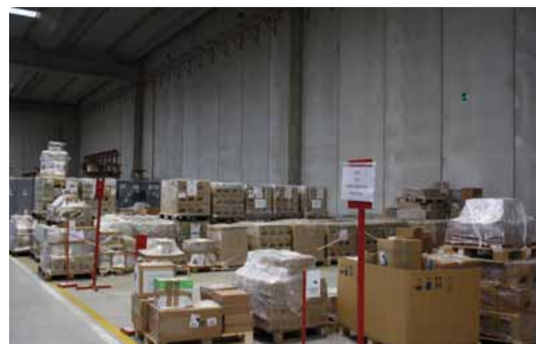
I contatori resi vengono smistati dagli operatori nelle postazioni a terra riservate ai materiali destinati allo smaltimento ovvero nelle locazioni a scaffale dove sono ricoverati i resi recuperabili identificati dal numero seriale